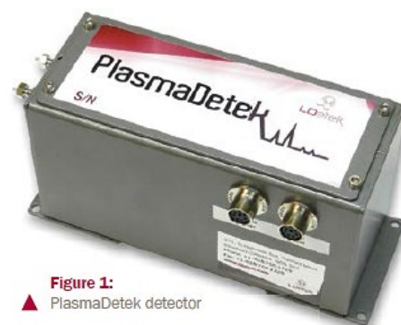
Figure 1: ▲ PlasmaDetek detector

このシステムには、水素ガス、空気、添加ガス、メタナイザーなど、その他の装置は必要ありません。これは、各化合物の測定にキャリアガスのみを必要とするスタンドアロンの検出器です